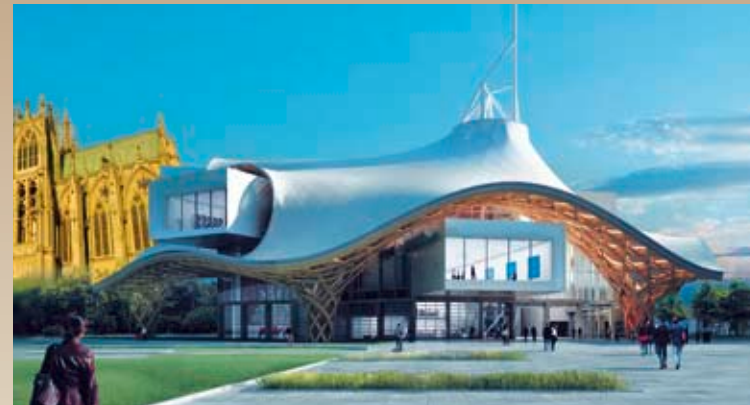
Metz - Centre Pompidou et cathédrale

Dans une configuration classique, face à la route, garantissant un confort optimal, dans un espace de 14 m. de long, véhicule tout équipé.