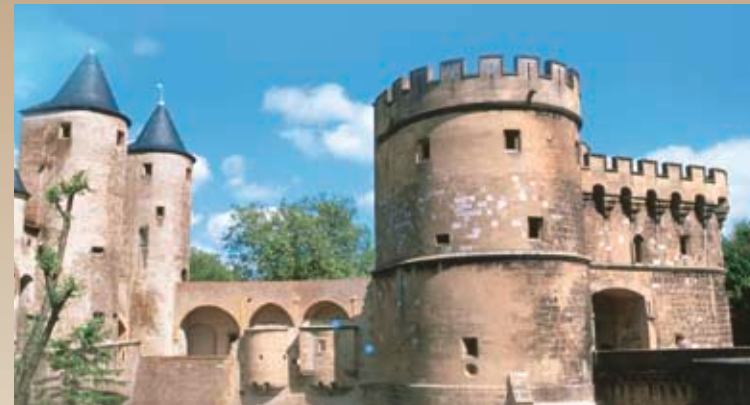
Metz - Porte des Allemands

Accessible aux personnes à mobilité réduite Ascenseur pour fauteuils roulants Attaches aux normes, rails de fixation, toilettes pour handicapés Kitchenette pour plus de fonctionnalité, service à bord.